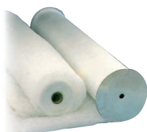
G3 - R 29