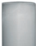
G3 - MK16 (nylon)