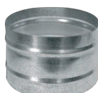
Λαμιοί σύνδεσης εύκαμπτων αεραγωγών