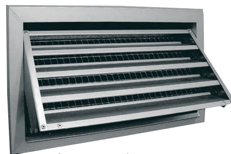
Τύπος BN Επισκέψιμο